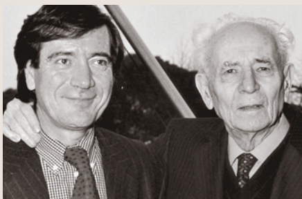
Insieme a Perrini