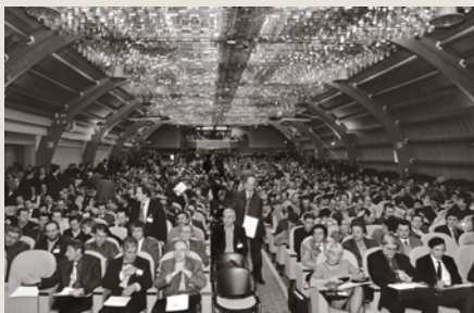
Il Palacongressi a Montecatini Terme, sede storica dei Corsi Gratuiti