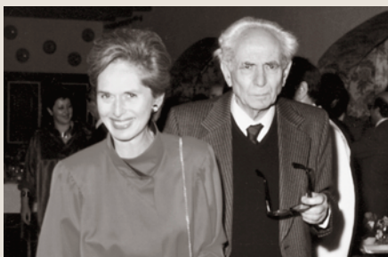
Con la moglie Cécile