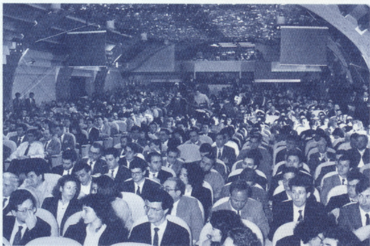
Il pubblico presente al XIX Corso della Fondazione.